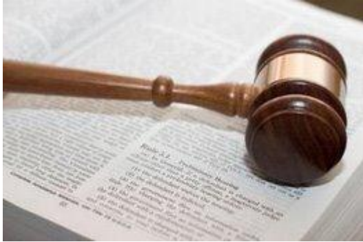
Fjordmans anledning #4

Europa blev en gång en dynamisk kontinent tack vare konkurrensen på alla nivåer. Det är nu nästan omöjligt att hitta en sektor av samhället som är oberörd av ofta överdrivna EU-förordningar. EU fungerar som en enorm superstat som styrs centralt av statister som är besatta av förordningar. De har inte lärt sig något av historien, där central planering har varit ett nästan universellt misslyckande.