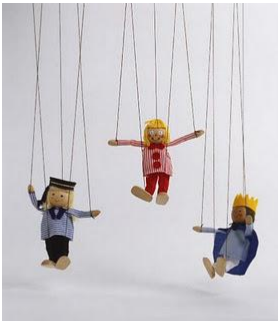
Fjordmans anledning# 9

Förespråkare av den Europeiska unionen hävdar att det är ett "fredsprojekt". Men EU handlar inte om fred, det handlar om krig: Ett demografiskt och kulturellt krig mot en hel kontinent, från Svarta havet till Nordsjön, för att förstöra de europeiska nationalstaterna och bygga ett imperium som drivs av självutnämnda byråkrater.