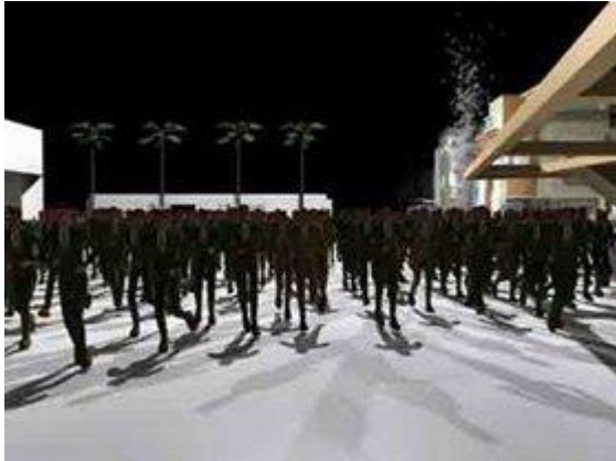
Fjordmans anledning #3

I en studie som offentliggjordes av organisationen Open Europe i augusti 2008 konstaterades att EU använder en "armé" av byråkrater och att det faktiska antalet individer som krävs för att administrera EU är nära 170,000 - mer än 7 gånger 23,000, en siffra som ibland anges av kommissionen.