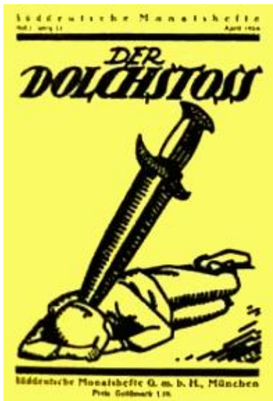
Fjordmans anledning #8

Den irländska folkomröstningen 2008 om den föreslagna EU-konstitutionen / Lissabon-fördraget är en kraftfull vittnesbörd om den onda karaktären i Europeiska unionen.