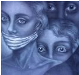
Fjordmans anledning # 7

EU bidrar inte till att främja frihet i Europa, utan ägnar i stället mycket tid åt att försöka avskaffa den lilla som är kvar.