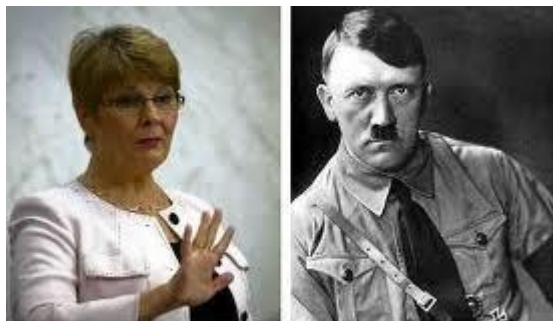
Hitler gjorde en del tokiga saker