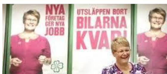
Centerns bruna förflutna

Dagens centerparti utmålar gärna alla som är kritiska mot den förda invandringpolitiken som "rasister" men om sitt eget bruna förflutna tigger man.