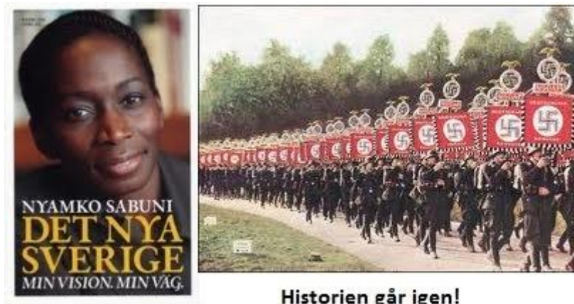
Historien går igen!